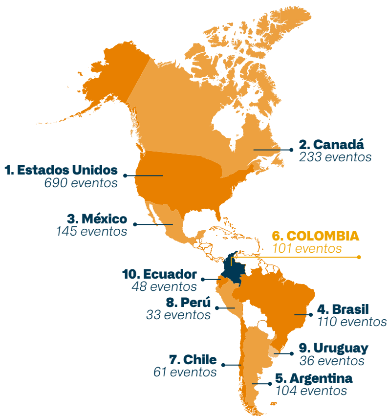
Ranking ICCA a nivel América

Colombia ha demostrado un progreso constante en el ranking ICCA en los últimos años, y Medellín ha sido un actor clave en ese ascenso. En el ranking Latinoamérica, Colombia es el único país con 3 ciudades en el top 10. Por su parte, Medellín ocupó el puesto 90 entre más de 370 ciudades del mundo, reportando 22 eventos. Entre los eventos que realizaron en el 2022 en Medellín, se destacan El Congreso Latinoamericano de Epilepsia, el Encuentro de Las Américas de Turismo Social, y el Congreso de la Federación de Entidades Organizadoras de Congresos de América Latina.